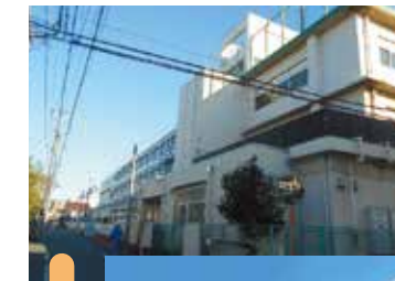
▲大森第四小学校 新校舎 (令和3年10月竣工)