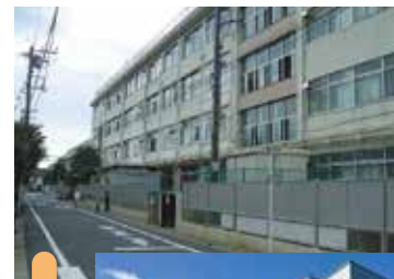
▲大森第七中学校 新校舎 (令和5年1月竣工)