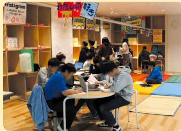
【オープンスペースで学習をすることたち】 (入新井第一小学校)

「おおた教育ビジョン」で掲げた理念「笑顔とあたたかさあふれる未来を創り出す力を育てます」の実現に向け、「大田区学校施設個別施設計画」に基づき、老朽化した学校施設の更新を計画的に進め、児童・生徒に安全でより良い学習環境を提供します。校舎を全て建替える改築事業においては、地域の拠点としての特色や、環境に配慮した学校づくりを推進します。