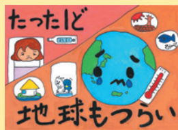
▲ 小学校低学年の部