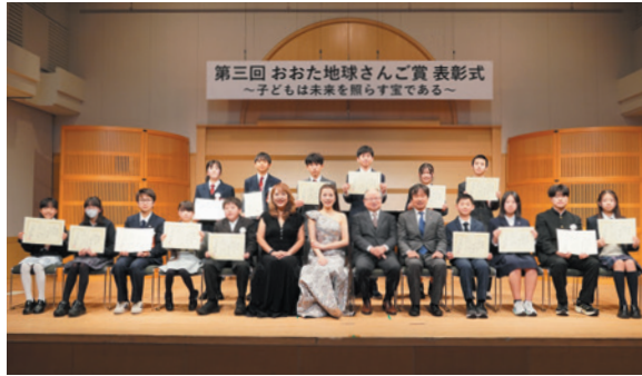
▲ 令和7年度「第三回おおた地球さんご賞」表彰式

「おおた地球さんご賞」は、「地球環境や地域の環境について考え、次の世代の行動につなげるプロジェクト」として、小中学生から作文やエッセイを募集します。