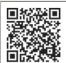
▲ 教育委員会の会議録

※予定が変更になる場合があります。傍聴を希望する方は、あらかじめ下記問合せ先へご確認ください。 ※手話通訳・要約筆記が必要な方は開催日1週間前までに、その他特別な配慮が必要な方は事前にご連絡ください。