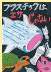
▲ 小学校高学年の部