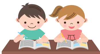
◀いろいろなプリントを用意しています。