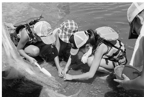
浜辺の生き物探検隊

主な交通手段 ◆京急「平和島駅」から徒歩15分 ◆「大森駅」から京急バス「平和島循環」で「平和島5丁目」下車徒歩3分。 申込方法 いずれも7月11日(木)から電話受付(先着順) TEL 5471-0333 FAX 5471-0347