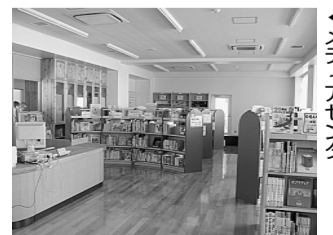
▲メディアセンター