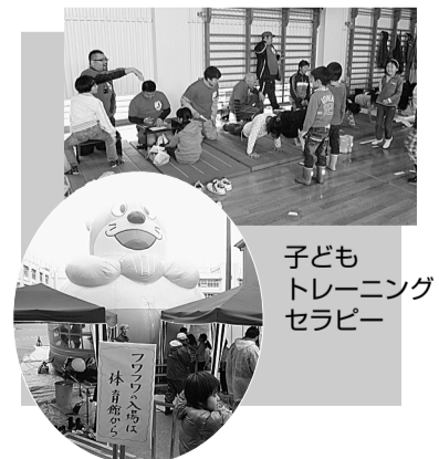
子どもトレーニングセラピー

子どもガーデンパーティーは戦後間もない昭和25年に、「こどもの日」の制定(昭和23年)を受けて、第1回が開催され、今年で第62回を迎えました。このように長く継続してこられたのも、実行委員である青少年対策地区委員会をはじめ、自治会町会・PTA・おやじの会等、多くの協力団体の皆様に支えられてきたおかげです。さらに、地域の警察署や消防署にも様々な協力を仰いでおり、まさに「地元のお祭り」です。各会場の地域の方々が、地の利を活かし趣向を凝らしたプログラムを準備してくださっているこの催しを、来年は晴れプログラムで実施できることを願っています。