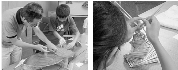
六郷のとんび凧作り

主な交通手段 ◆地下鉄「西馬込駅」から徒歩8分。 ◆「大森駅」北口改札山王方面の東急バス「荏原町駅入口行き」で「万福寺前」下車徒歩2分。 申込方法 いずれも7月11日(木)から電話で受付(先着順) TEL 3777-1070 FAX 3777-1283