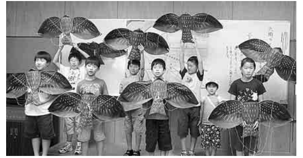
体験学習会(とんぼ凧づくり)

地下鉄「西馬込」駅から徒歩8分。 「大森駅」山王北口から東急バス「荏原町駅入口行き」で「万福寺」下車徒歩2分。