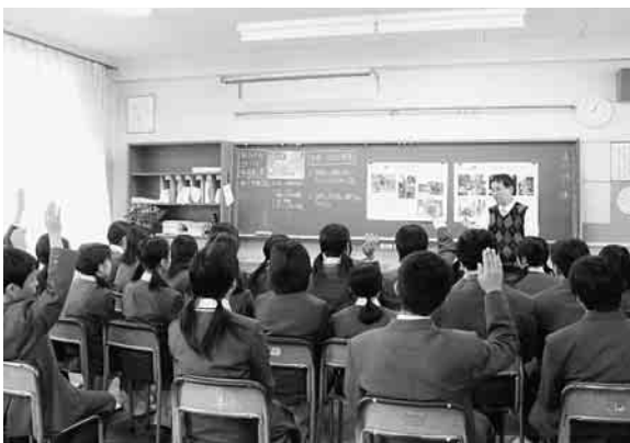
世界の教育事情をテーマに、約200万人が同時に受けた「世界一大きな授業」(大森第十中)