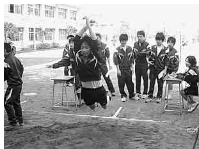
新体力テスト・立ち幅跳び(大森第二中)

1学期には、全ての区立小学校の5・6年生と中学生を対象に新体力テストを実施しました。