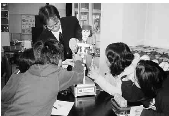
区内企業のもつ高い技術力が子どもたちを育てる「おもしろ理科教室」(大森東小)

本年3月には、大田区基本構想審議会から今後20年を展望する基本構想の審議のまとめが、区長に答申されました。