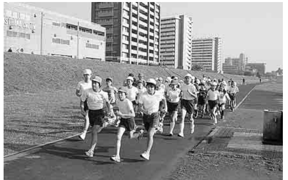
多摩川土手を走る子どもたち(南六郷小)

そして、11月はマラソン月間です。学年ごとに目標の距離を設定するとともに、5・6年生は多摩川土手でのマラソン大会に取り組みます。また、子どもたちが意欲的に取り組めるようがんばりカード(記録カード)を作成するなど、子どもたちの成長に合わせた取り組みの工夫をしています。