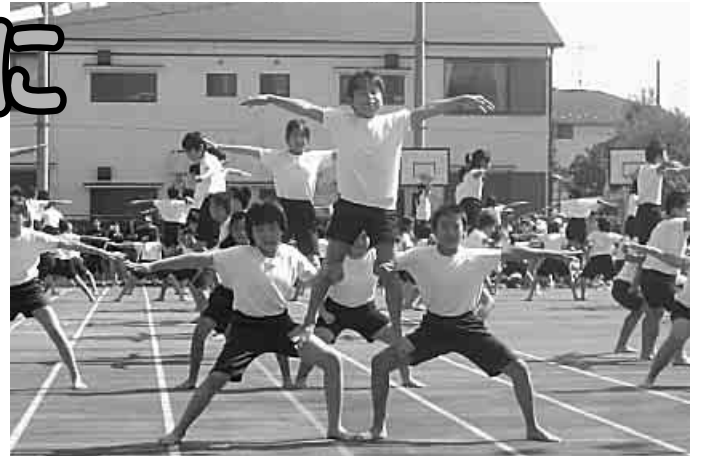
運動会で、力をあわせて組体操(羽田小)

教育委員会では、学校や家庭、地域と連携を図りながら、子どもたちの心と身体と知性がバランスよく成長・発達するよう体力向上・健康づくりに取り組んでいます。