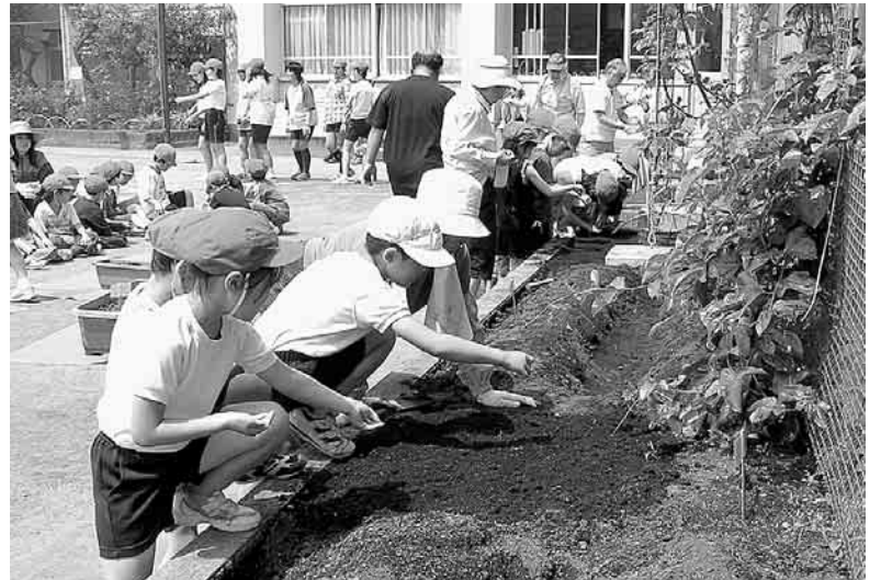
学校支援ボランティアの方と一緒に生活科の授業「とうもろこしの種まき」(おなづかり)

平成20年3月26日付けで、教育長に就任しました。 地域・保護者の皆様のご支援をいただきながら、より充実した大田の教育をめざし、取り組む所存でおります。 どうぞよろしくお願いたします。