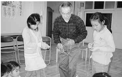
「べいごまを回そう」