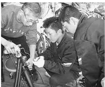
自転車整備(蒲田中)

大田区では、全中学校で五日間ほどの職場体験ができるよう地域の方々の協力を求めています。