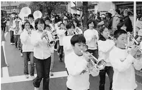
「大田フェスタ参加」