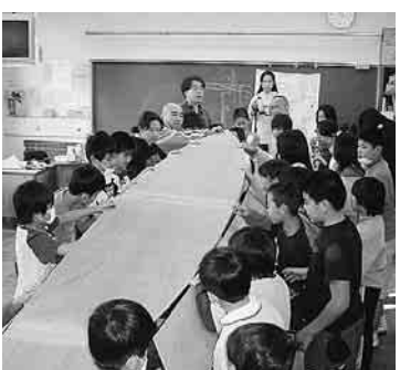
渡し船づくり(矢口小)

「ものづくりフォーラム」や「ものづくり科学教室」などが行われ、子どもたちが地域の産業に興味や関心をもつ大切な機会となっています。