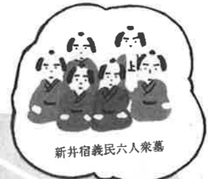
新井宿義民六人衆墓