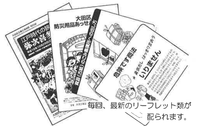
毎回、最新のリーフレット類が配られます。

これからも地域が、より活力のある快適な暮らしの場になるように、各町会自治会の委員の方々の活発な活動が期待されます。