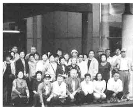
旧新井宿七丁目町会