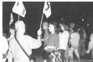
夜の避難誘導訓練

10月19日午後4時30分地震発生、町内に家屋倒壊を想定して、夜の避難訓練の始まりです。春日公園に集合、避難所へ誘導する訓練をしました。土曜日の夕方にもかかわらず、二百余名の方が参加されました。本来は大森三中へ避難することになっておりますが、文化の森へ町会役員、PTA役員の協力が高齢者や子供を安全に誘導しました。婦人部による炊き出しで、アルファ化米のカレーライス等を試食しました。また、阪神淡路大震災のビデオによる防災の心構えを学びました。訓練中、町内の保安の為、保安委員が巡回を行いました。