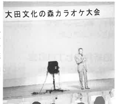
大田文化の森カラオケ大会

7月31日、8月1日と大田文化の森に於いて、新井宿自治会連合会と、大田文化の森運営協議会の共催で、地域の皆さんの憩いと交流を目的とした夏の一大イベントが開催されました。広場中央には櫓が設置され、そのまわりを、各町会婦人部を中心に、可愛い浴衣姿の子ども達も参加した盆踊り大