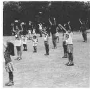
ラジオ体操 (山王公園で)