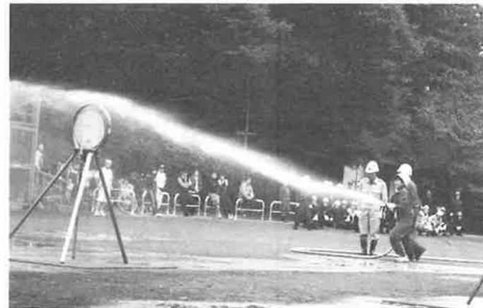
大森第三中の生徒によるミニポンプ操法訓練