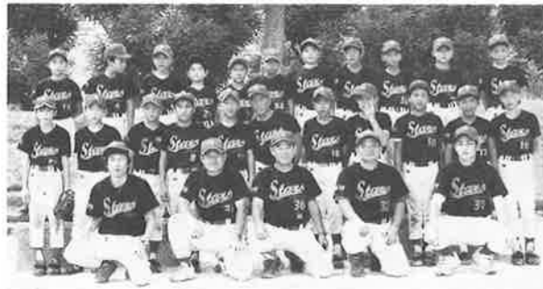
平成16年8月 全日本小学生男女ソフトボール大会にて

重なる地方遠征や猛暑の中のとらかった練習も、大きな世界での活躍とともに貴重な思い出となりました。区役所では区長さんから直接激励の言葉を戴き、また、応援には滋賀県まで青少対からもご参加して戴きました。新井宿地域のスポーツチームとして、多くの地域からのご支援を戴いたことも、また、私たちの誇りとして感謝しております。ありがとうございました。