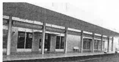
〔講堂〕災害時には窓を全て開放。負傷者が濡れないよう、ひさしも大きくなっている。

10月11日、大森赤十字病院が全館オープンしました。オープンに先立ち9月30日に内覧会が開催されました。新病院は「災害に強い病院」として免震構造を採用しています。また、講堂を正面玄関脇に配置し、災害時には救護活動のスペースとして活用します。