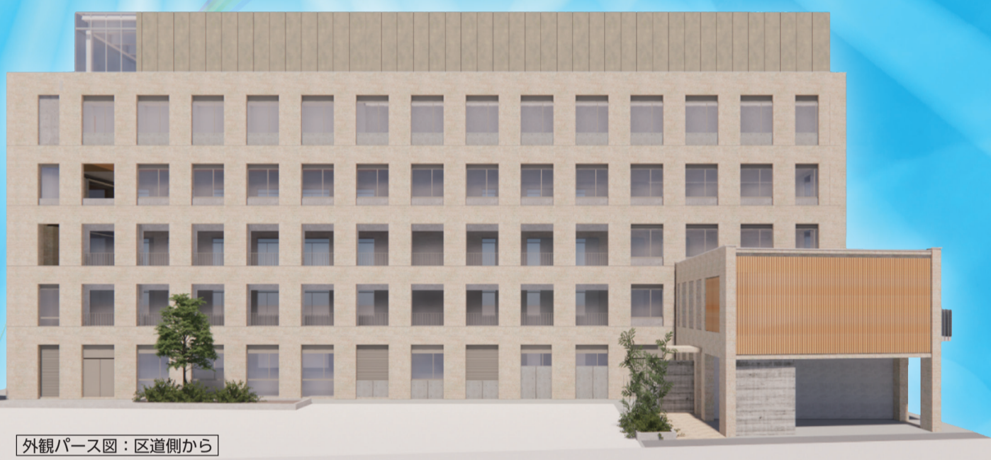
外観パース図：区道側から