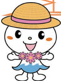
ふる浜まつりPRキャラクター「コハマちゃん」