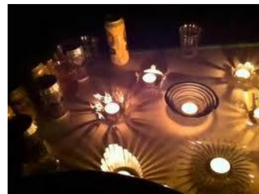
完成したキャンドルスタンド