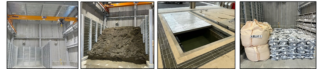
【ホイストクレーン】 【土砂ストックヤード】 【水槽】 【土のう置場】