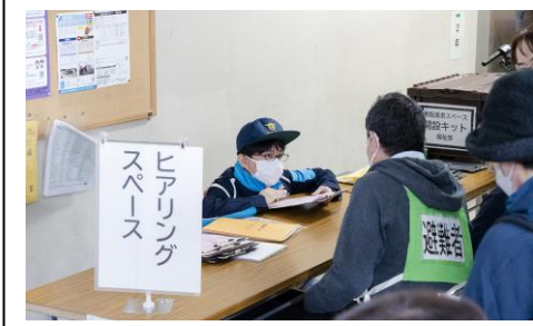
避難者のヒアリング