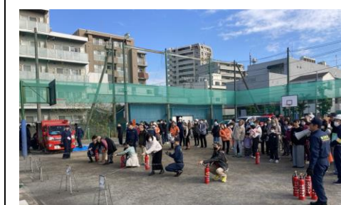
初期消火訓練（消火器訓練）