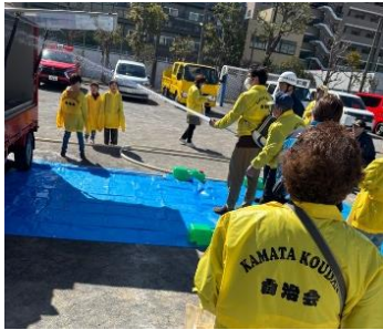
初期消火訓練（まちかど防災訓練車）