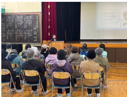
やさしい日本語講座の様子