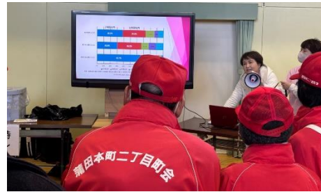
簡易トイレの啓発