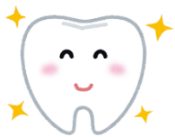
ねたきり高齢者訪問歯科支援