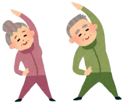
一般介護予防事業