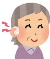
補聴器購入費助成