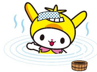
いきいき高齢者入浴事業