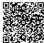
自分らしい老いじたく