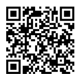
老いじたく情報登録事業