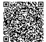
ホームヘルプサービス