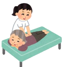
はり・きゅう・マッサージ 指圧施術割引券