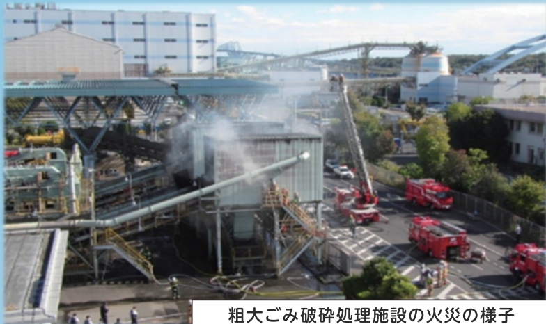
粗大ゴミ破碎処理施設の火災の様子