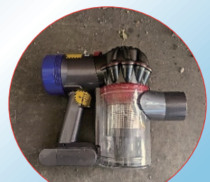
コードレス掃除機