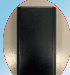
モバイルバッテリー