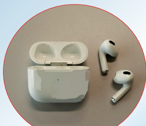
ワイヤレスイヤホン

リチウムイオン電池などの中には燃えやすい液体が入っており、収集作業や破碎処理などのごみ処理の工程で押しつぶされると、熱を持ち、発火します。