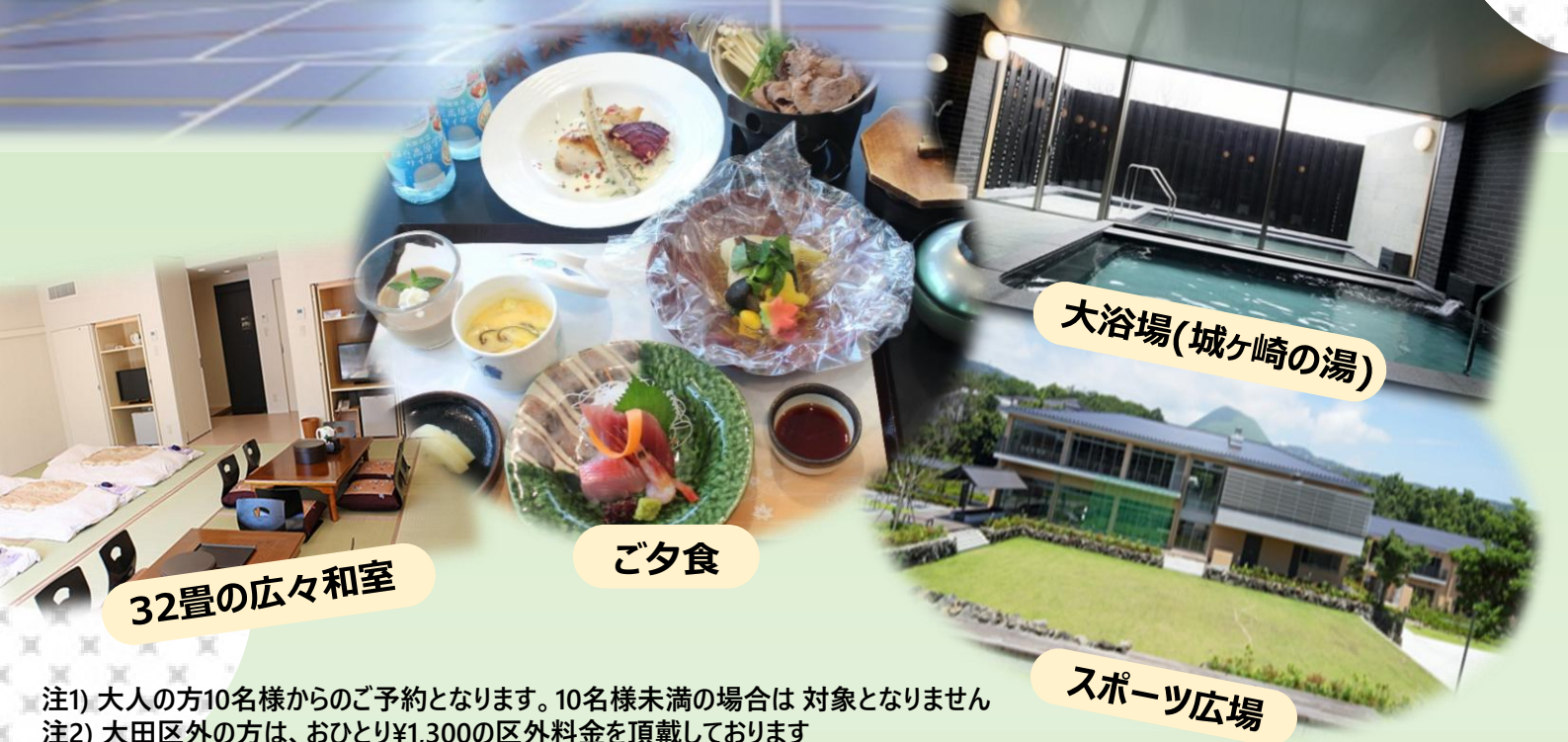
大浴場(城ヶ崎の湯)

“健康的で伊豆らしい特別な食事”と“体育室2時間貸切り”を含む、お得な限定プランです。