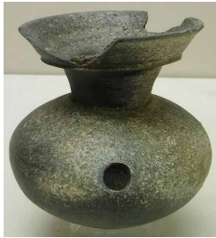
すえき 須恵器 はそう でんえんちやうふあかさかこぼんしつど 田園調布赤坂古墳 出土