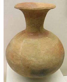
つぼがたどき 壺形土器 くがはらいせきしつど 久ヶ原遺跡 出土