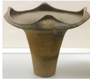
ふかばちがたどき 深鉢形土器 かみいけがみいせきしつど 上池上遺跡 出土