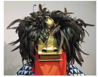
めじし 雌獅子 むすめ しし (娘の獅子)