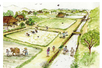
イメージ図/渡部道子氏画