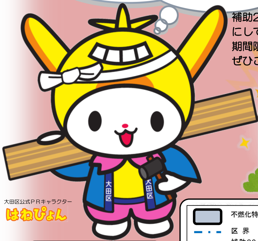
大田区公式PRキャラクター はねぴょん

補助29号線沿道地区を災害に強いまちに していく特別な助成です 期間限定【2030(令和12)年度末】まで ぜひこの機会にを除却をご検討ください