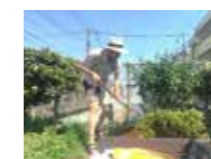
ハンガリー出身のメンバーさん