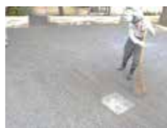
達人のようなホウキさばき