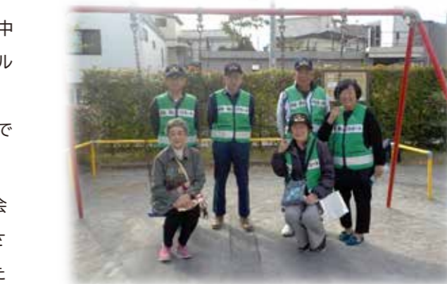
活動メンバーのみなさん