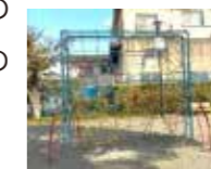
特徴的な遊具もあります(同じ遊具は、区内3か所！)