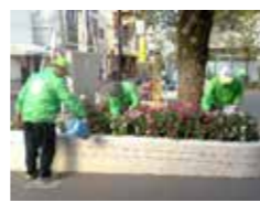
とても丁寧に花壇の手入れをされています🌟