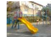
ひろびろとした園内