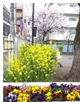
桜と菜の花の共演！