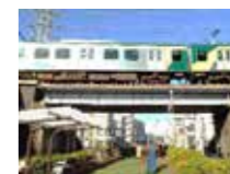
電車で手を振る光景も♪