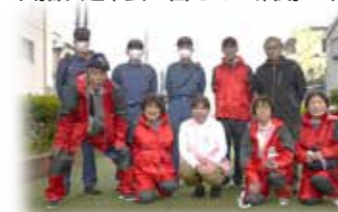
11/15の応急救護講習の開催記念写真