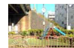
柵と植栽に囲われています