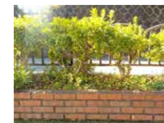
手入れ後の見通しのよい植栽

今後は、さらに活動の幅を広げ、公園を利用する子ども世代、親世代、祖父母世代が繋がることができる「多世代交流」の場を目指して、様々な取り組みを計画中とのこと♪直近では、近隣の保育園・地元自治会・商店街の方々に直接オファーして応急救護合同訓練を実施し、沢山の方々にご参加いただけたとのお話もありました。地域力を最大限に活かし、『横』の連携を深めながら、魅力溢れる場を目指す途草会の皆さんの活動に今後も注目です！！