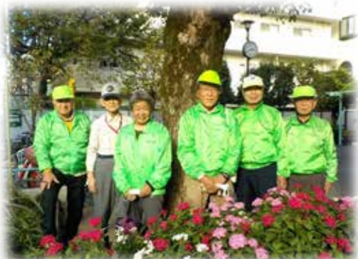
活動メンバーのみなさん

お話を聞いている中で、活動中の皆さんがとてもイキイキと楽しそうに取り組まれている姿がとても印象的で、皆さんの真心のこもった日々の活動が、公園利用者の気持ちよく過ごせるこの形に繋がっていることを実感しました。これからも、ますます地域に親しまれる魅力あふれる公園を期待しています！！