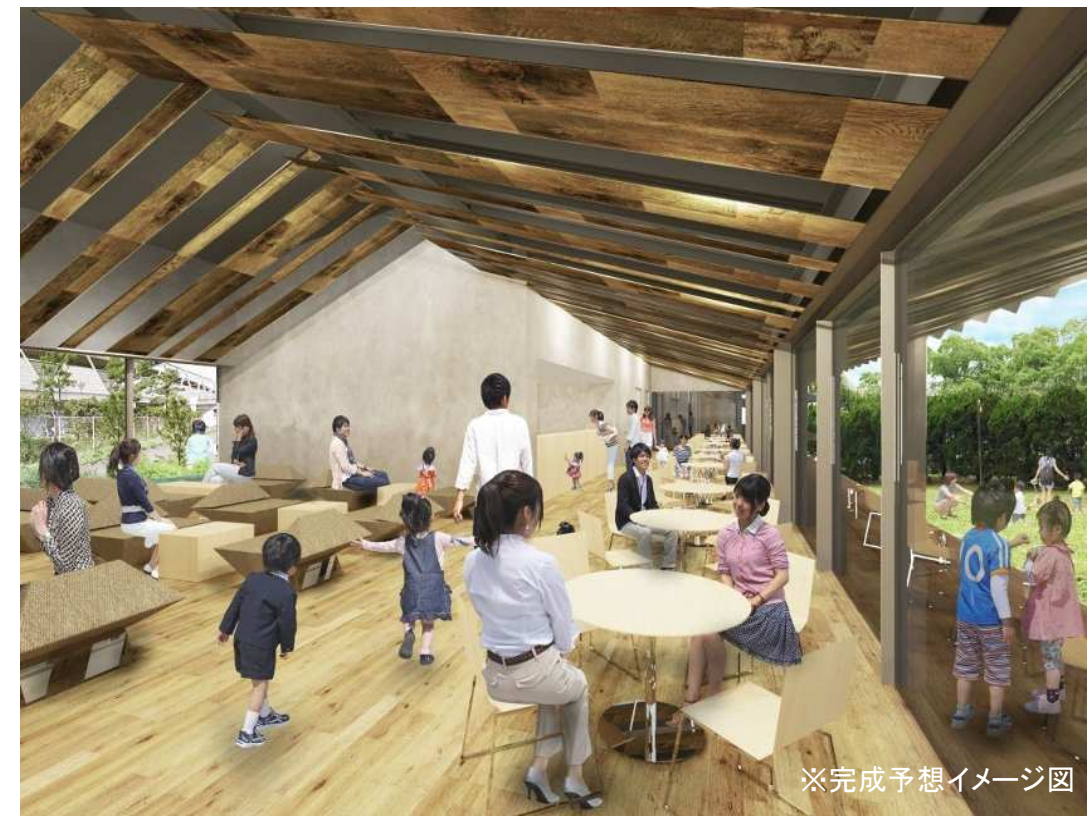
※完成予想イメージ図