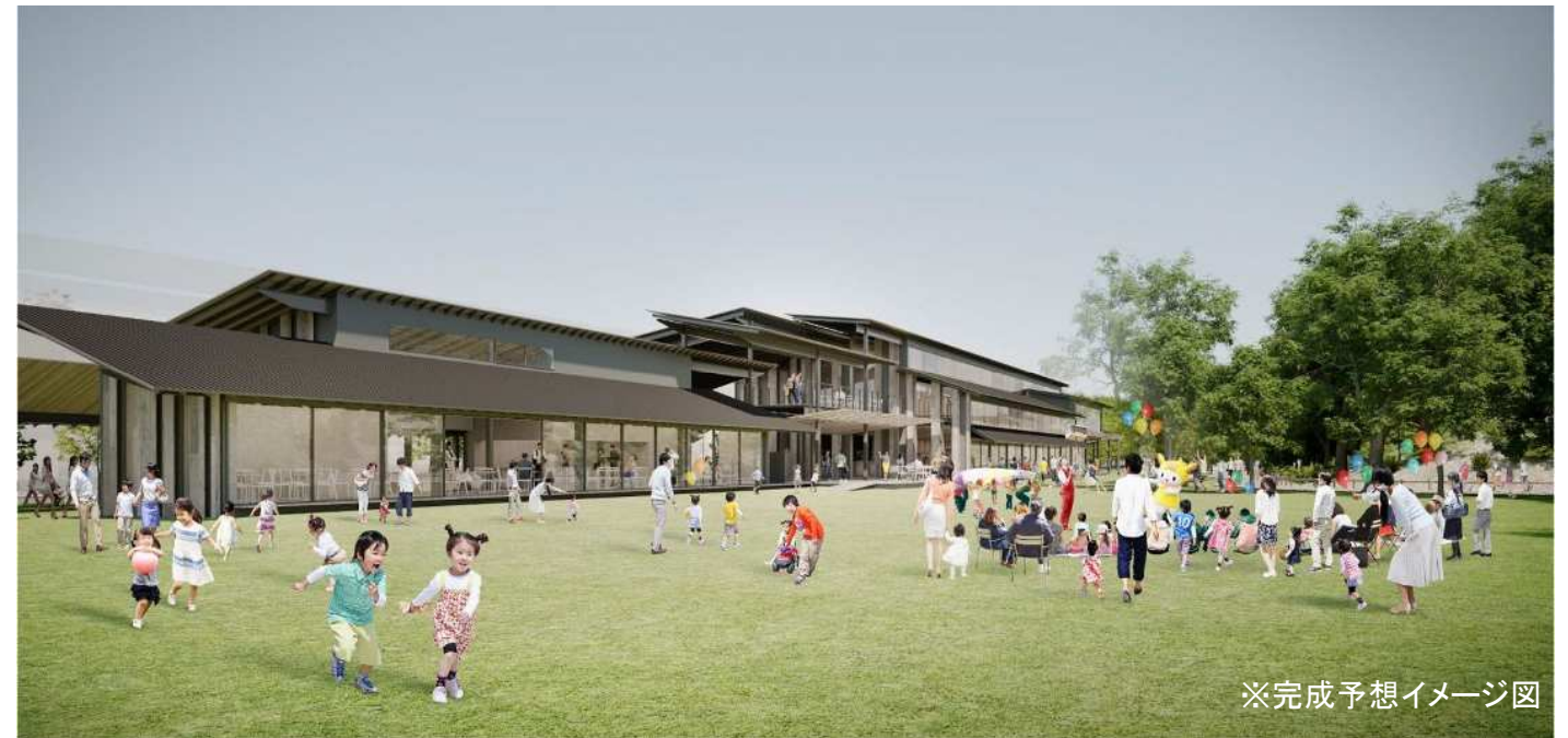
※完成予想イメージ図