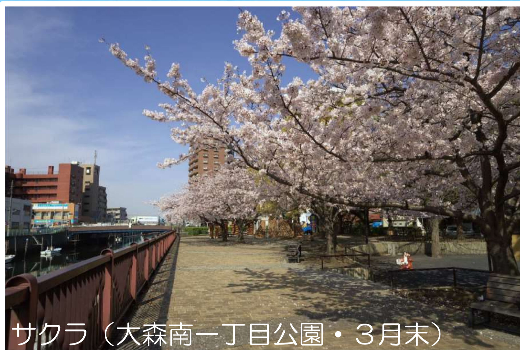
サクラ（大森南一丁目公園・3月末）