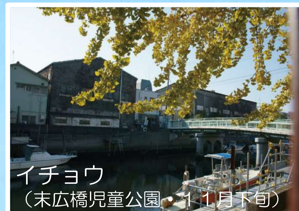
イチョウ （末広橋児童公園・11月下旬）