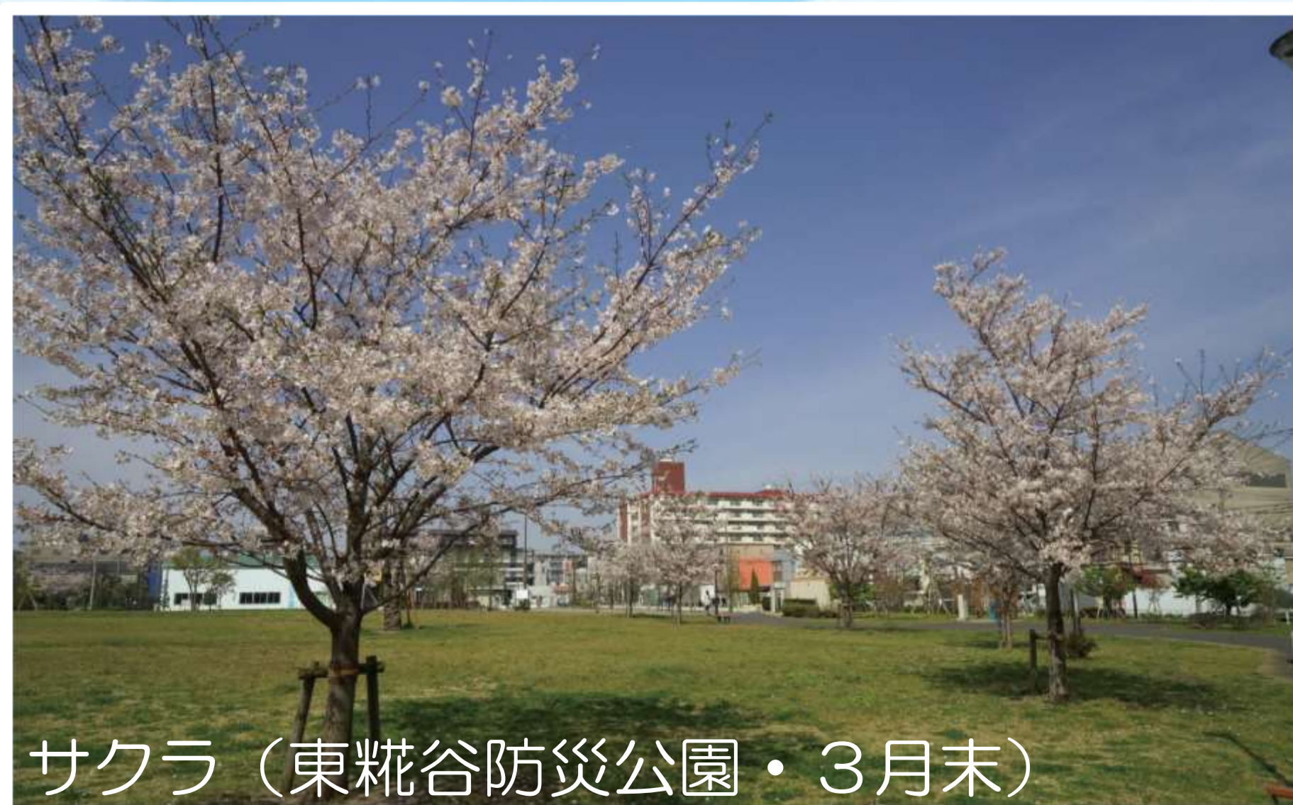
サクラ（東糀谷防災公園・3月末）