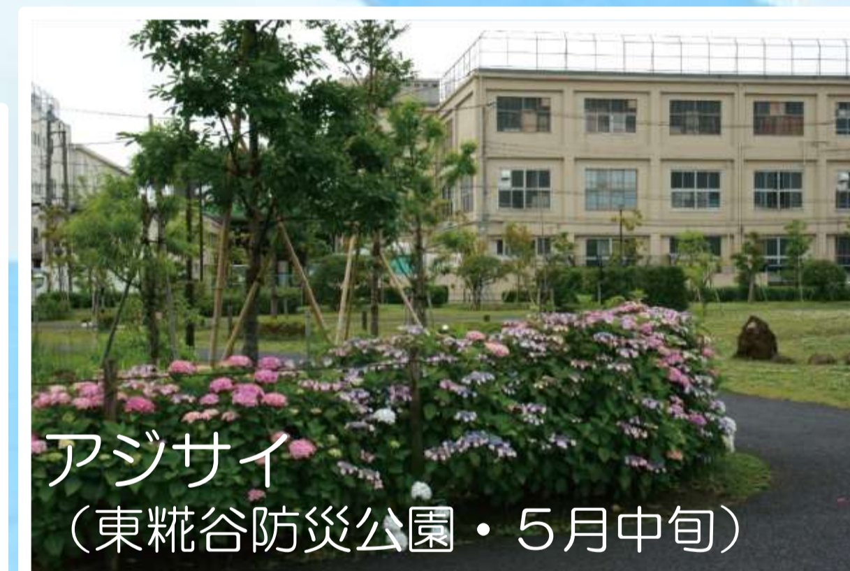
アジサイ （東糀谷防災公園・5月中旬）