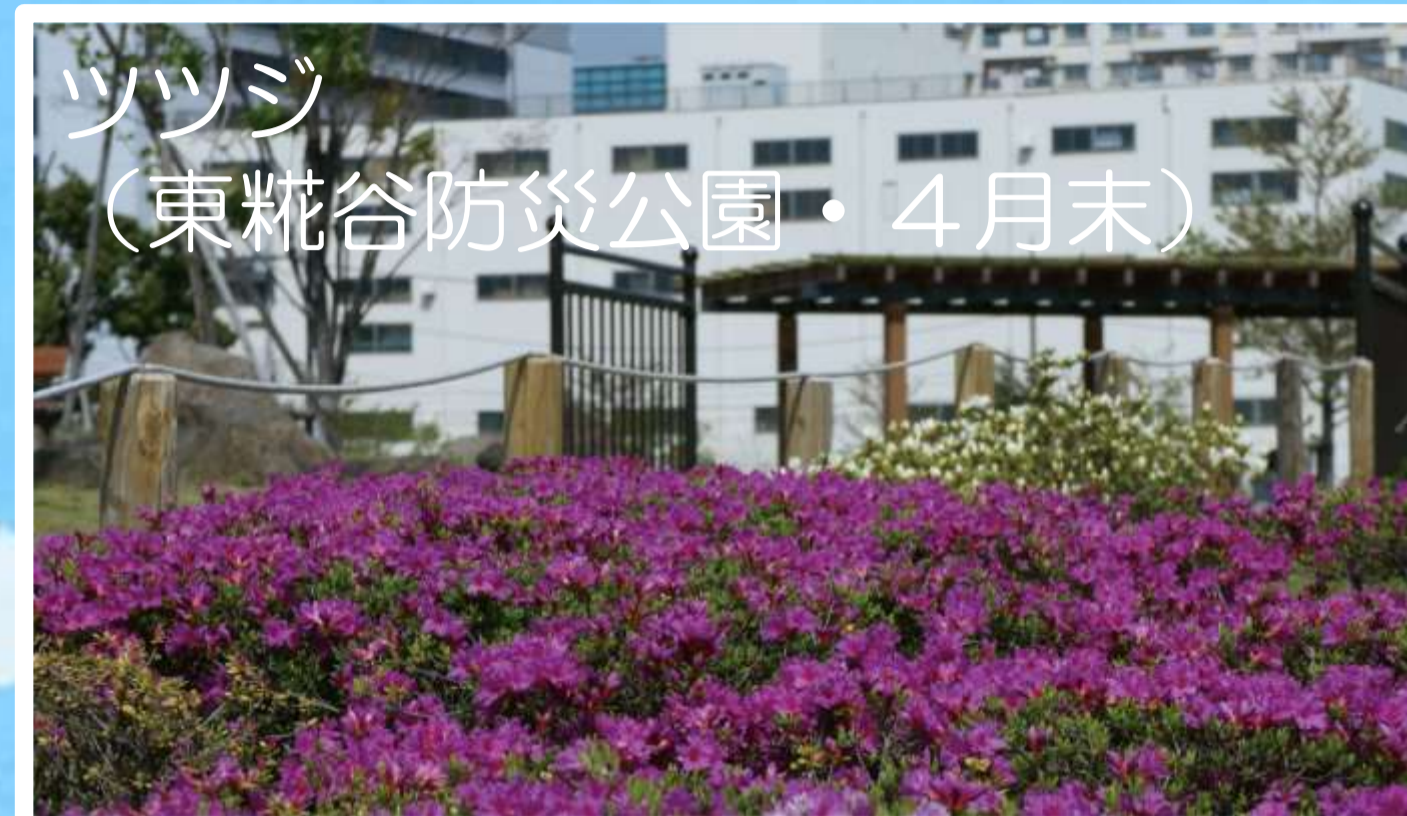
ツツジ （東糀谷防災公園・4月末）