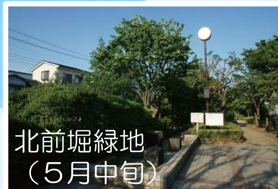
北前堀緑地 （5月中旬）