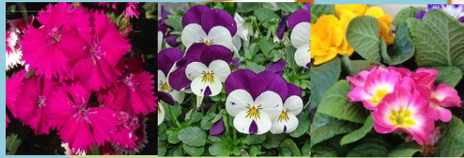
田園調布 ナadeshiko、ピオラ、プリムラジュリアン