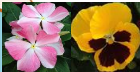
嶺町 ニチニチソウ、パンジー