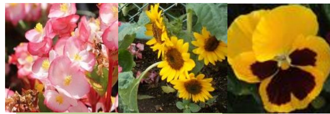
久が原 ペゴニア、ミニヒマワリ、パンジー