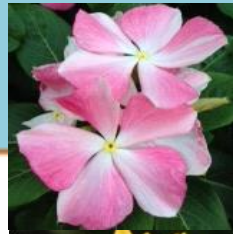
馬込 ニチニチソウ、 ヒマワリ、 シクラメン