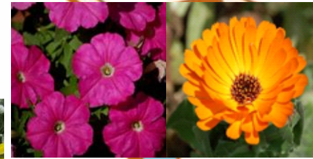
大森東 ペチュニア、キンセンカ