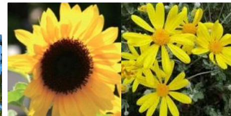
蒲田東 ヒマワリ、ユリオプスデージー