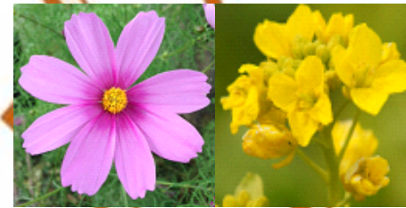
大森西 コスモス、ナノハナ