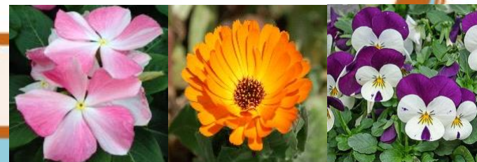
羽田 ニチニチソウ、キンセンカ、ピオラ