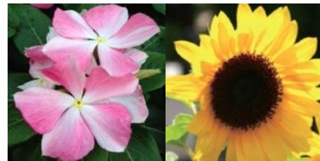
池上 ニチニチソウ、ヒマワリ