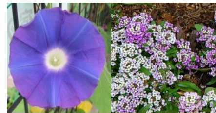
新宿 アサガオ、アリッサム