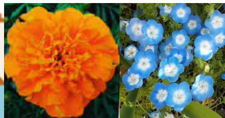
蒲田西 マリーゴールド、ネモフィラ