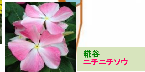
糀谷 ニチニチソウ