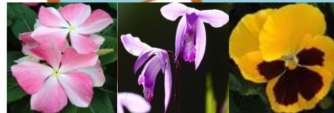
入新井 ニチニチソウ、シラン、パンジー