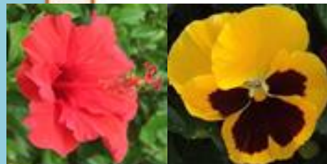
鞆の木 ハイビスカス、パンジー