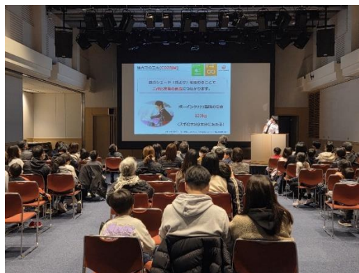
(日本航空株式会社)