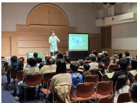
(eco 実験パフォーマーらんま先生)