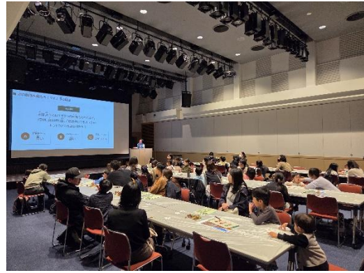
〈NPO 法人樹木・環境ネットワーク協会〉