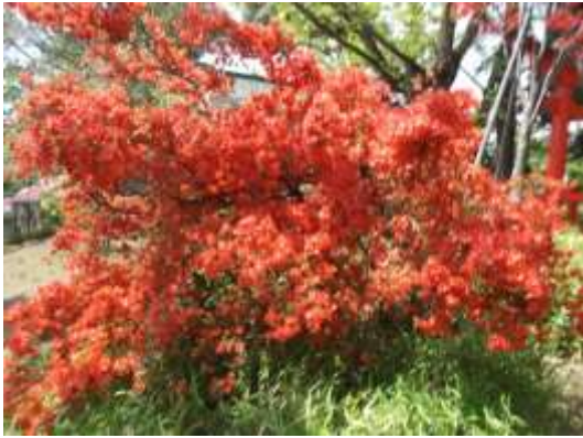
ヤマツツジ (洗足池)