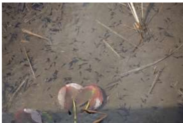
ヒキガエル (オタマジャクシ)