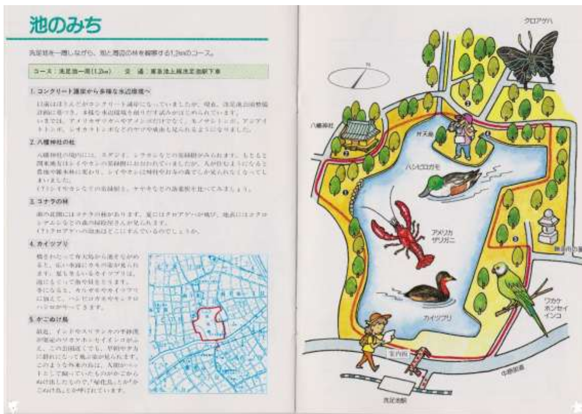
「大田区の自然観察路」 1995（平成7）年3月発行パンフレットより

その後、洗足池の大池に対して小池と呼ばれていた溜池とその周辺を整備し、2009年に大田区立小池公園として開園したため、今回コースの見直しを行い、小池公園（東急池上線長原駅より徒歩4分）を加えて、大田区自然観察路「池のみち」とした。