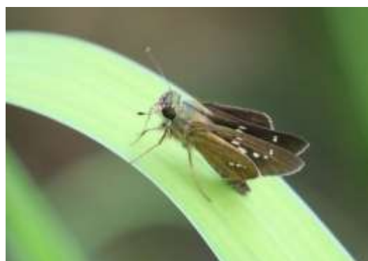
イチモンジセセリ