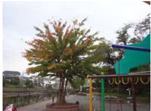
ミツバカエデ (小池公園)