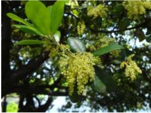
ウバメガシ (洗足池)