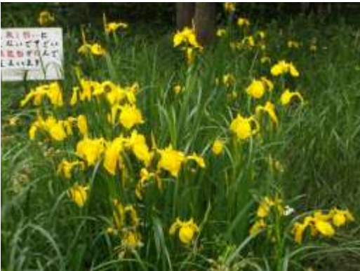
キショウブ (洗足池)