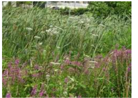
ミソハギ (小池公園)