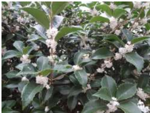
ヒラギモクセイ (小池公園)