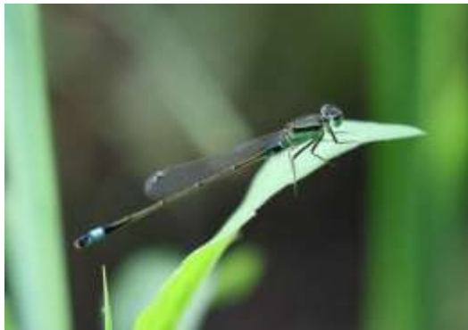
アオモンイトトンボ