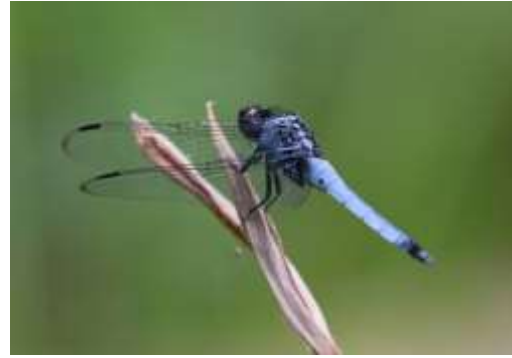
オオシオカラトンボ