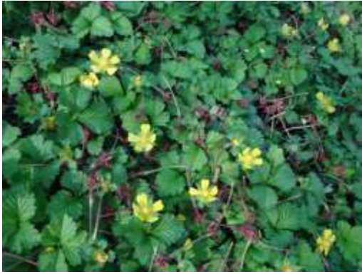
ヘビイチゴ (洗足池)