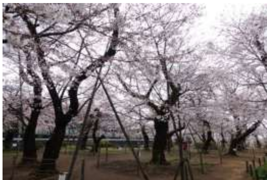
ソメイヨシノ（洗足池）