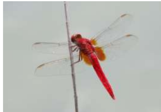
ショウジョウトンボ