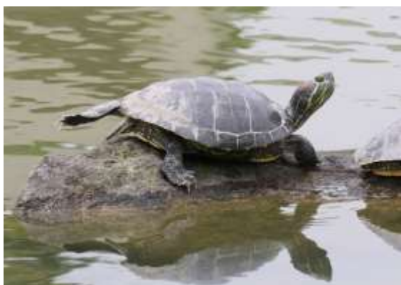
ミシシippアカミミガメ