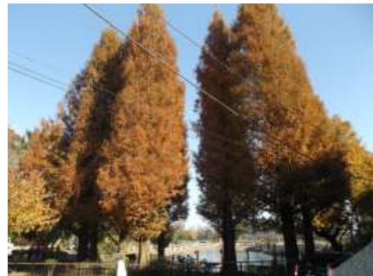
メタセコイア（洗足池 左：4月、右：12月）