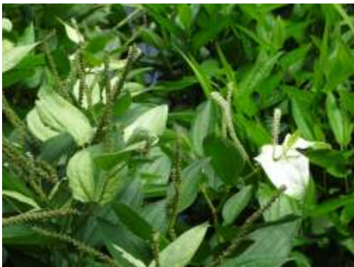
ハンゲシヨウ (洗足池)