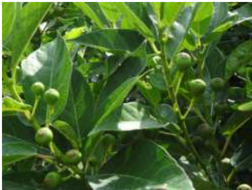
イヌビワ (小池公園)