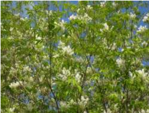
アオダモ (小池公園)