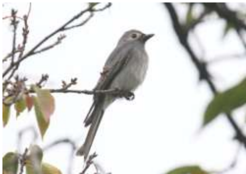
ハイイロオウチュウ