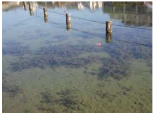
オオカナダモ (小池公園)