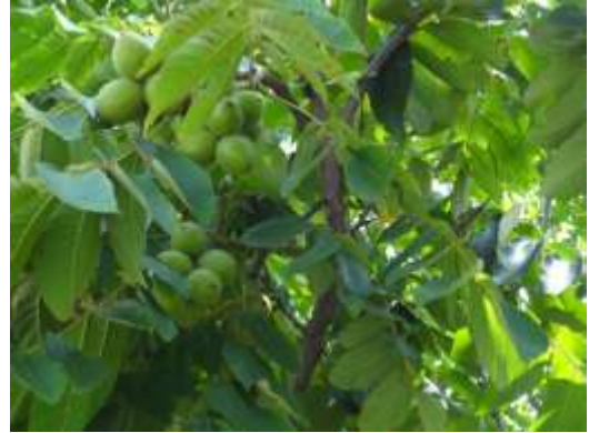
オニグルミ (小池公園)