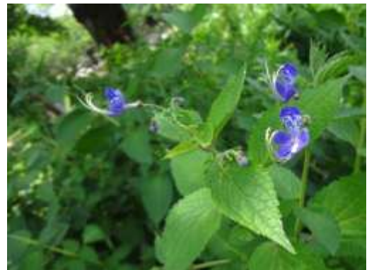
カリガネソウ (洗足池)