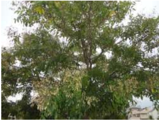
シマトネリコ (小池公園)