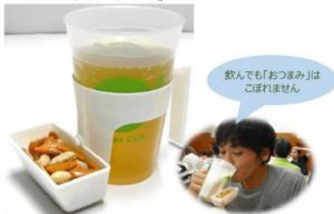
リユースカップホルダー 「おつまみポケット」