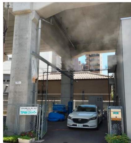
純水ミストシャワー試作品