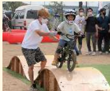
電動バイクの試乗

7・8月は「だれでも! PARK!! 2022」。50mの布地に思いっきりお絵描きなどを楽しみました。9月は「Sunday E Park」。電動バイクの試乗や、プロのトライアルライダーのパフォーマンスなどが行われました。参加者はまちなかの公園とはちょっと違った遊びを楽しんだ様子。実際にどんな公園ができるのか、期待が膨らみます。