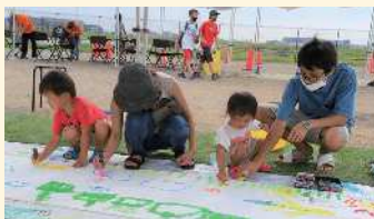
キャンパスは無敵大!