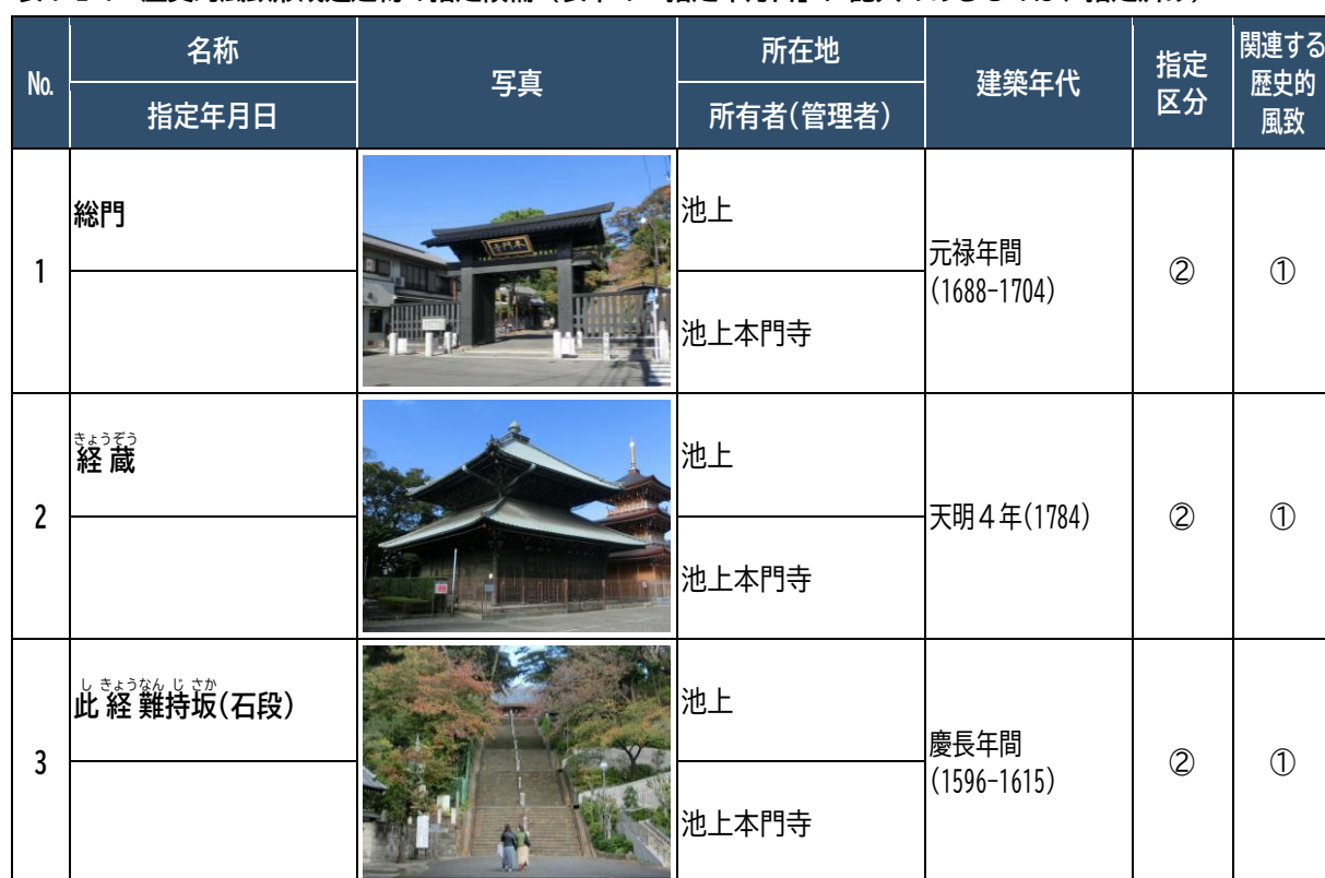
表 7-2-1 歴史的風致形成建造物の指定候補（表中の「指定年月日」に記入のあるものは、指定済み）