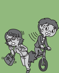
与行人相撞! 造成对方负伤…