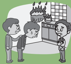
租借的房屋 发生火灾…

留学生本人由于“日常生活中引起的事故”，或者“因留学而进入的投宿、居住设施的使用而引起的事故”，导致他人负伤、损坏他人物品而应负损失赔偿责任时，支付保险金。