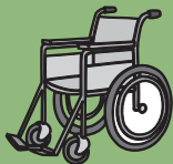
滑雪时撞到树上， 留下后遗症…