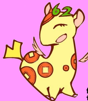
個人住民税PRキャラクター ぜいきりん