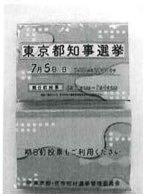
ポケットティッシュ