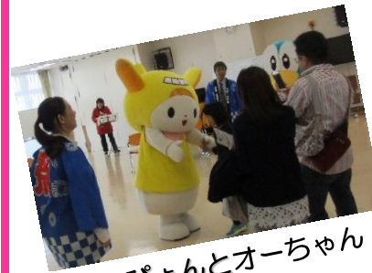
はねびよんとオーちゃん

昨年11月3日の文化の日に、2回目となります「さぼーとぴあ スペシャル・デー」を開催しました。昨年同様、「さぼーとぴあ」を知っていただくとともに、さぼーとぴあ周辺地域の盛り上げを目的に、新井宿福祉園のお祭りと同じ日に開催しました。