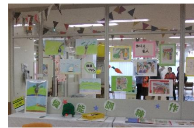
さぼーとぴあ内の風景

当日は700名以上の方々に来所していただきました。来年度も多くの方々に喜んでいただけるように実施したいと思いますので、よろしくお祈りします。ありがとうございました。