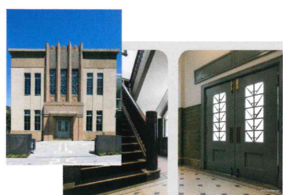
クリアファイル(旧清明文庫) (400円)