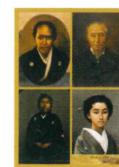
ポストカード 「勝家の肖像画」 (100円)