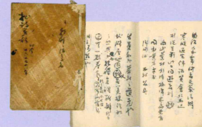
「拙詩并歌 旧今廿六廿廿八年」 (海舟自筆)

海舟が明治26(1893)年～28年頃にかけて詠んだ詩歌がまとめられている冊子。