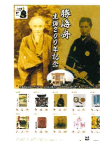
生誕200年記念切手 (1800円)