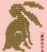
「勝伊代子自製紹刺標本」より