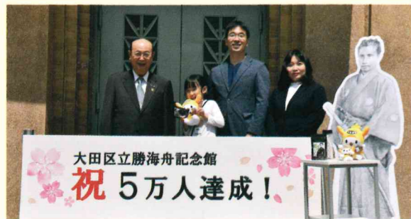
来館者5万人記念写真(勝海舟記念館にて) ※撮影時のみ一時的にマスクを外しています