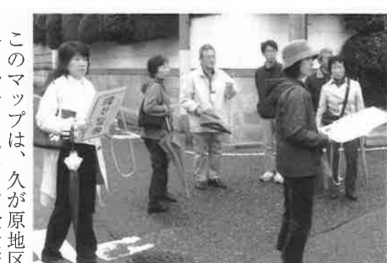
このマップは、久が原地区の各自治会を通して、全世帯に配布いたします。 (小原洪一)

なお、マップの名称の募集を行い、七名の方から十四件の応募をいただきました。委員会にて検討の結果、いづれも優秀な方がいたため「くがはら安心・安全マップ」といたしました。ご協力いただきました皆様、ありがとうございます。