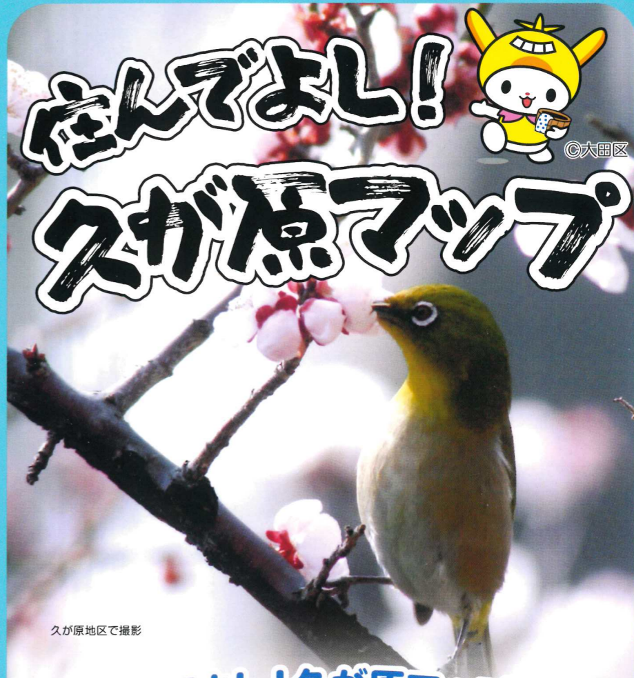
久が原地区で撮影

久が原特別出張所(地域力推進久が原地区委員会事務局) 住所：〒146-0085 大田区久が原 4-12-10 電話：03-3752-4271 FAX：03-3752-4514