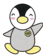
民生委員キャラクター ミンジー

久が原地区民生委員児童委員協議会には、14名の民生委員・児童委員と2名の主任児童委員が在籍し、日々、地域に住む一人一人に寄り添って活動しています。