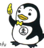
保護司キャラクター ホゴちゃん

久が原地区は大田区保護司会第三分区の管轄で、7名の保護司が在籍し、犯罪や非行のない地域社会を築こうと働きかけています。