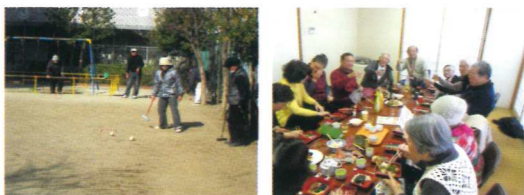
シニアクラブ(道々橋寿会)ゲートボール シニアクラブ(ヒルズ久が原シニアの会)