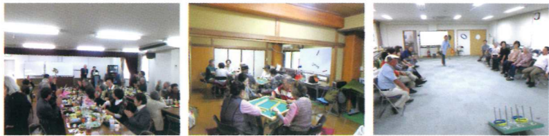
シニアクラブ(喜楽会)カラオケ シニアクラブ(久が原クラブ)麻雀 シニアクラブ(東寿会)輪投げ

シニア会は、老後の生活を健全で豊かなものにするため、概ね60歳以上の方が集まり、健康の増進や生きがいを高めるための活動を行っています。久が原地区には、5つのシニアクラブがあり、手話ダンスや輪投げ、おしゃべり&カラオケ、健康ウォーキング、ゲートボール、太極拳など幅広い活動を行っています。