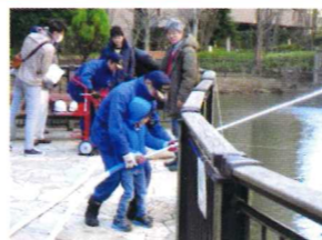
ヒルズ久が原自治会震災訓練