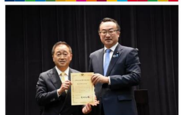
岡田地方創生担当大臣(右)から選定証を授与される鈴木区長(左)