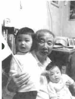
我が家も次世代にバトンタッチ

からも今まで通り、悪い事や人に迷惑をかける事なく、自分に出る事は一生懸命、おごらず、たかぶらず、楽しくやっていたらと思っています。又鵜の木地区7町会の皆様とお会い出来た事を幸に思いつつ、次は会長さんにバトン・タッチしたいと思えます。