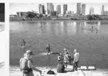
うのき水辺の楽校