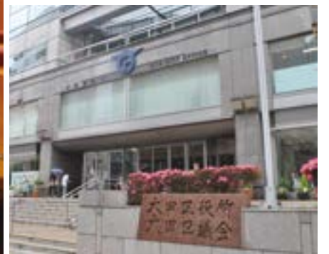
【大田区役所本庁舎入口】 区議会と区長は、独立した立場から相互に協力し、区民福祉の向上に努めている。

【大田区議会本会議場】 大田区議会は、この議場で毎年2月、6月、9月、11月の4回の定例会と、必要に応じて臨時会を開催する。5月1日から新たな議会構成のもと、より親しまれる区議会を目指し活動している（議会の構成と議員紹介は2～3面参照）。