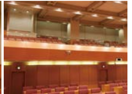
【傍聴席】 席数は76席。ガラス張りで防音の親子席や、車椅子スペースも設置している。