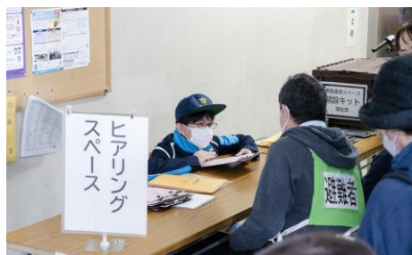
避難者のヒアリング