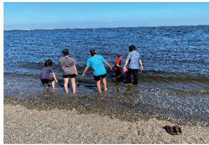
海遊びの経験をする子ども