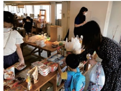
こども食堂でのフードパントリー