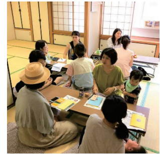
子育て中のお母さん同士が気軽にしゃべりできる場所

子どもたちや子育て家庭のための福祉的な活動を行っている団体の活動に対し、助成金などの支援を行っています。