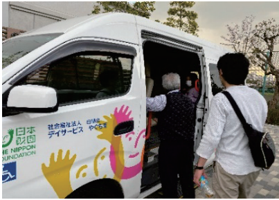
社会福祉法人が協力して送迎

小学校の低学年を対象に、学校に通えない子どもたちに学習と多様な経験の機会となる居場所を提供しています。