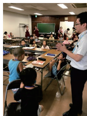
夏休みの子どもの居場所 「ひまわり教室」

子どもの支援に携わる地域活動団体の活動の支援を行います。また、地域における個別課題を抱えた子育て家庭や、社会的自立に課題を抱えた若年層の相談の受け止め、行政等の関係機関へのつなぎ役も担います。