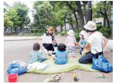
外遊びやイベント・工作などを行い親子の交流の機会や居場所を提供

子どもたちや子育て家庭のための居場所を提供している団体のサロン活動に対し、助成金などの支援を行っています。