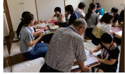
学習支援団体の方と一緒に夏休みの宿題を行う様子