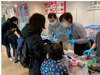
蒲田駅東西連絡通路でのフードドライブイベント

地域のこども食堂やひとり親家庭などへ、食料配付（フードパントリー事業）などを通じ支援をするため、ご家庭や企業・団体の皆さんから、未利用の食料・食材を集める活動（フードドライブ事業）を行っています。