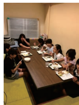
こども食堂の様子

区内 31 か所(令和 4 年 1 月末時点)のこども食堂の連絡会の事務局を担っており、こども食堂間の情報交換の場の設定や寄付食料の提供や、こども食堂の立上げの際の相談などを随時行っています。