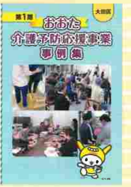
▲第1期おおた介護予防応援事業 事例集