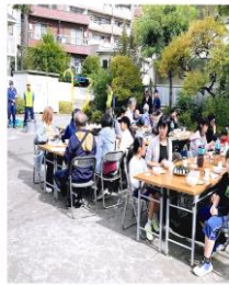
災害に備えた地域活動

私達は東日本大震災後に、災害への備えや安心して暮らし続けられる地域づくりを目指して、見守り・支え合い活動をスタートしました。まず、日頃から顔の見える関係作りをと、挨拶・声かけを積極的に行っています。