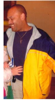
イエローキャブの運転手さん

もう二十年以上も前のことです。友人達とニューヨーク旅行に行った時のことです。数日後、ポストン市内観光をする為に集合場所のホテルまでタクシーで移動しました。支払いを済ませタクシーを降りた時に、財布をバックに入れ損ねた気がしてタクシーを覗きましたが、見当たりませんでした。そのまま、ホテルの中に入り、再度バックの中を確認したところ、財布は見つかりませんでした。もうこの旅は終わった。仲間にも心配や嫌な想いをさせてしまいました。財布に目の方が真つ暗になりました。財布には、カード、現金が入っており、言葉も分からず、連絡先も分からず途方に暮れていた時に、入口から財布をぐるぐる回しながら、タクシーの運転手さんがこちらに走ってきてくれました。私はもう腰が抜けてしまい、その場に座り込んでしまいました。一晩中クラク