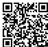
【防災マップに関する二次元コード】

大田区では、区立小学校、中学校等の9カ所を避難所として指定し、自治会・町会単位で割り当てています。