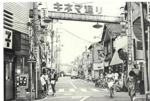
昔のキネマ通りの入口

この「キネマ館」という映画館の名前から「キネマ通り」と銘名されたのではないのでしょうか。