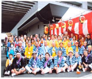
令和7年度蒲三まつり

た開催案である。当日は神酒所の開設、神輿の御霊入れも無事に終わり本番を迎えることができた。内容的には大人神輿、子供神輿、山車の巡行。参加者には実行委員会から多くのお土産に子供たちは大喜び。模擬店に