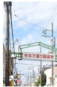
栄えていた頃のキネマ通り

私の幼少期、昭和十七年頃の「キネマ通り」は車の往来もななく静かな通りでした。道の両側には木造の平屋が立ち並んでいた様に思います。