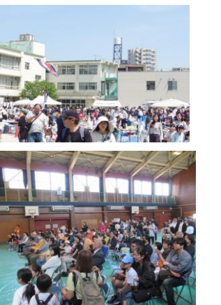
賑わいを見せた当日の様子

今までガーデンパーティーは、糀谷地区・羽田地区と合同で、萩中公園・萩中学校・出雲中学校で実施していました。しかしながら、蒲田東の子どもたちが行くには遠過ぎることと、今回から地元蒲田東で開催することになりました。実施会場は蒲田小学校と決まりましたが、初めての蒲田東での開催ですので、いろいろな事がゼロからの出発でした。決めることはいっぱい有りましたが、青少年の委員にそれぞれの担当をお願いしてみんなの力で、乗り切ることが出来ました。ありがとうございました。また、どれだけの団体が出席して下さるか？未知数で、とても不安でしたが、たくさんの方が応募してくださって、心強い限りでした。