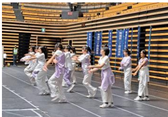
まもりんでのダンス発表

十月五日、私達ダンス部は大田区総合体育館でダンスを披露しました。この発表は、三年生は引退をして一、二年生だけで披露する初めての場でした。また、練習時間も二週間と短く、私達は焦っていました。立ち位置を変えることや、ダンスの振り付けを変えるなど多くの調整をしました。この二週間で部員みんなが全力で頑張ったので息の揃ったダンスを披露することが出来ました。練習では部員同士で教え合うなど、みんなの頑張りがとても伝わってきました。当日は焦りもありましたが、全力でダンスを踊ることが出来て本当に良かったです。一人一人の思いがあったから良い発表が出来たと思います。これからも蒲田中学校ダンス部の応援をよろしくお願いします。