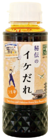
plate lunch Nanary 秘伝のイケだれ ¥540

住所 〒146-0082 大田区池上4-32-2 TEL 03-6410-3985 営業時間 11:00~19:00 定休日 月曜日