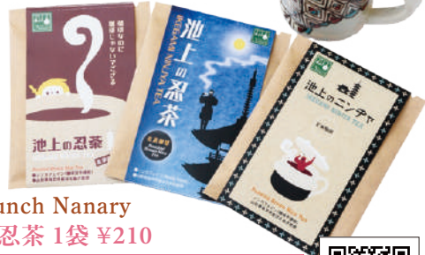
plate lunch Nanary 池上の忍茶 1袋 ¥210

山形県産の高級米を使用したノンカフェインの玄米コーヒー。お湯を注ぐだけのドリップバッグ。