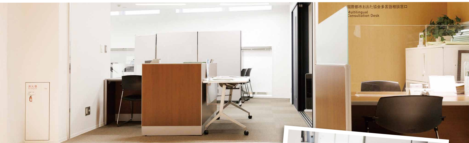
国際都市おおた協会多言語相談窓口 Multilingual Consultation Desk