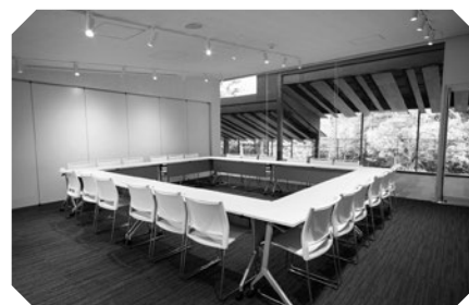
Silid para sa pagpupulong