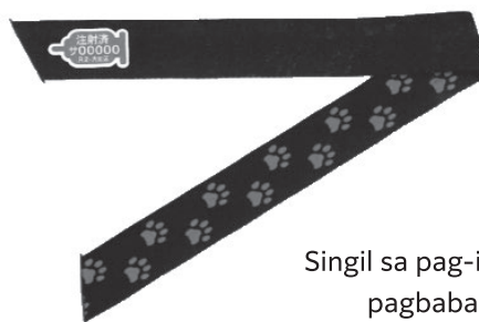
Singil sa pag-isyu ng kasulatan ng pagbabakuna 550 yen