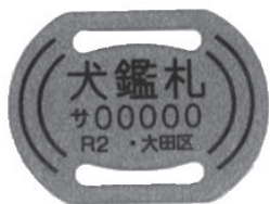
Singil sa pagpaparehistro 3,000 yen