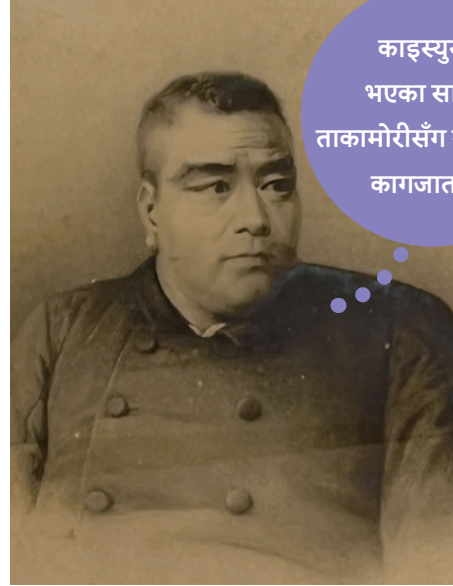
काइस्युसँग भएका साइगो ताकामोरीसँग सम्बन्धित कागजातहरू